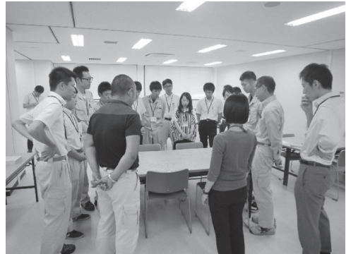
福岡市水道局対話型研修（2015年7月）

ギャラリー・ツアーは、それぞれのテーブルの風土をたいせつにする。研修やワークショップに向く。イエローマークは、収穫の特定をする簡単な方法で、テーブルクロスの、重要と思われる箇所に目立つ色で強調をしたのち、ギャラリー・ツアーを行う。テント・カード（重要なキーワードをテーブルクロスの落書きから抜き書きしたもの）を作成してテーブルに並べ、ギャラリー・ツアーを行うこともある。テント・カードに自由にコメントを書き込めるとしたり、賛同の印をつけることを加えても効果がある。