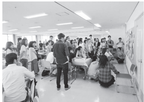
未来会議 in いわき2013（2013年8月）

モンスター・スティッキー・ウォールは、大規模ダイアログ、意見収集、講座に向く。特に、コンセプト（基幹概念の割り出し）やプロジェクト・スターター（個別の活動グループの立ち上がり喚起）を志向するとき、効果を発揮する。最終ラウンドなどで、壁に貼り出す付箋を、発言者ではなく、聞いた者が聞き取りを書く「ストーリーテリングカフェ形式（会話のフィードバック）」もしばしば導入した。追加のグラフィック・レコーディングやリレー発言（壁のキーワードに補足発言をし、気になるキーワードを選んで次の発言者を指定する）などを行うと、さらに、共有感と一体感が増し、出力された成果に当事者性が喚起される。また、その当事者性の喚起を目的に、貼り出すときの分類整理を、ファシリテーターが行うのではなく、参加者が相互に連携しあいながら自ら行う方法もたびたび援用した。