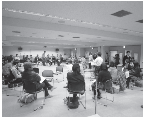
いわき未来会議（2013年4月）

に移行することによって、ひるがえって焦点が明確な即席の分科会が開かれることで、行動への段階を着実に進むことになる。ここでも、グラフィック・レコーディングの活用が効果的である。マグネットテーブルは、OSTが情熱と責任に即して少数のテーマ提供者が名乗りを上げるのに対して、全員が何らかのキーワードを書き、そのキーワードを頼りに、呼びあう者どうしがグループを形成する、OSTの簡易版である *13 。OSTやマグネットテーブルののちは、グループごとに発表する時間を短縮するため、しばしばファシリテーターからのグループテーマ読み上げ報告のみとすることもあった。