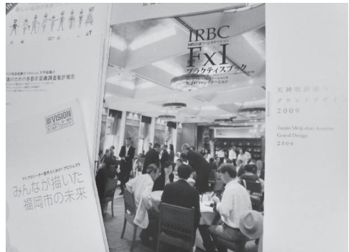
報告書・提言書にまとめることも重要な事後活用

ごくまれに、カードに要点を記入し、そのカードを回収するなどして、特に明示的な収穫セッションを置かないこともある。これは、ふりかえりや市民参画、意見収集などで、キーワード出しとその収集そのものを目的とするときで、回収したものには、活用する責任が発生する。成果活用の観点からは、回収の際、「参考程度にする」ととどめず、活用の事後計画をしっかりと参加者に伝えるべき責務を有する、とすべきである *14 。「参考程度」以上の活用を行うとき、これは、「協創的ヒアリング」と呼べるものであり、アンケートに替わる、質の高い調査を行うことができる。活用にカード・インテグレーション技法などを用いて、統合された意見の全容を捉まえる調査報告を行うなど、しばしば多数者協働の重要な局面で、このハーベスト技法を用いてきた。