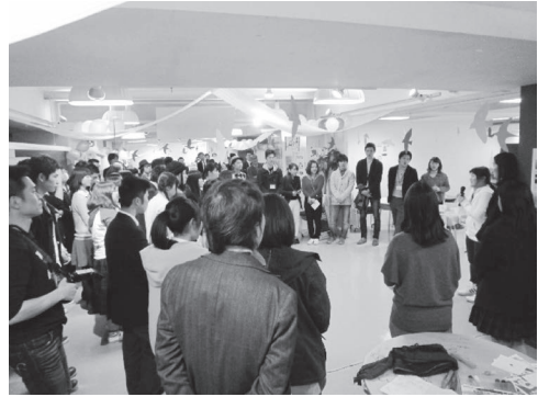
北九州市まなびとESDステーション 大学生による高校生・中学生対話「北九州夢サミット」(2015年3月)

全体での会話は、意見交換や相互啓発のワークショップ、また、講座や交流会に向く。シンプルで深い終わり方を迎えることになる。少人数が推奨される。テーブルレポートは、ファシリテーター以外に、レポーターを置き、参加者に成り代わって客観的にテーブルクロスを紹介するもので、これによって、ワールドカフェの会話のラウンド中の話しやすさから一転、全体での発言となることからの発言のしにくさ乗り越えることができる。