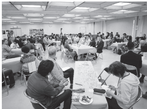
未来会議 in いわき (2015年10月)

フィッシュボウルは、コンファレンス、研修、アーカイブを目的とする対話に向く。グラフィック・レコーディングを加えるとよい。また、内側のディスカッサント(議論者)と外側の観察者を同数とすることがフィッシュボウルの原則だが、大規模な場において中央でディスカッサントがふりかえり的な報告の対話を行うなら、「代表者ミーティング」と呼ぶほうがよい。代表者が摘出されたテーブルから中央へ送り込まれるという構造をして、全体を象徴する最終のカフェの会話、ということが演出され、結論性・統合性が高くなる。時として、ファシリテーターも代表者ミーティングのテーブルに着く。